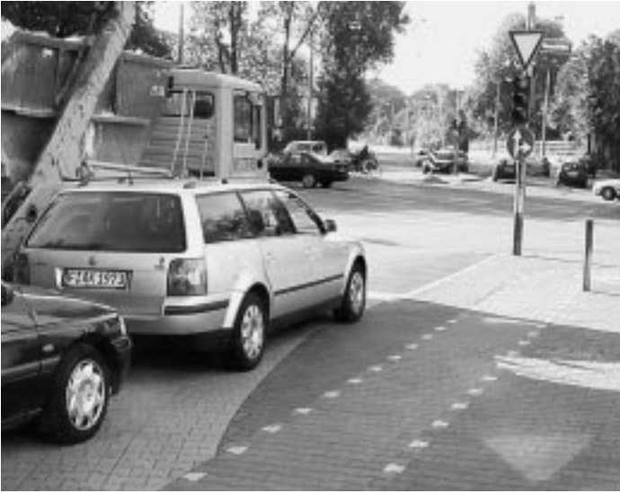
Gefährliche Ecke – schlechte Sichtbeziehungen durch Falschparker auf dem Radweg und fehlende Furtmarkierung an der Kreuzung Hansaallee / Miquelallee