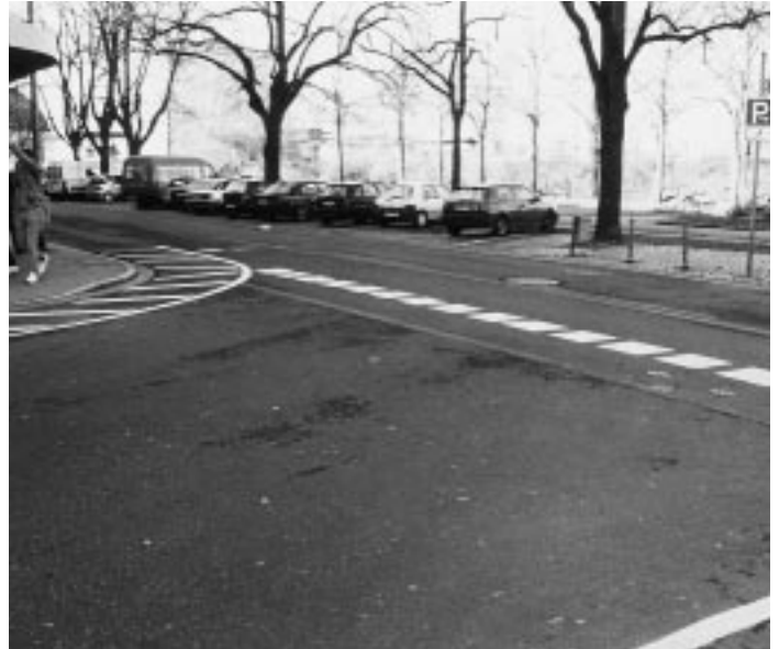
Abb. 2 Die Markierung an der Einmündung der Albanusstraße in die Dalbergstraße suggerierte eine nicht mehr bestehende Vorfahrtsberechtigung (aus der Zeit vor Einführung der Tempo 30-Zone).