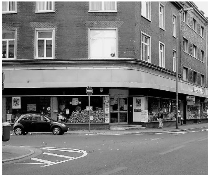
Abb. 3 Heute ist die irreführende Markierung entfernt.