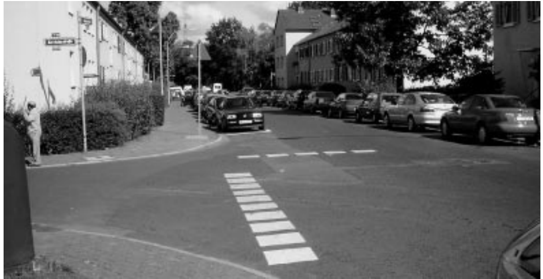
Abb. 1 Einmündung der Auerhahnstraße in die Jägerallee in Ffm-Griesheim: Markierungen verdeutlichen die Vorfahrtsregelung, rücksichtsvolleres Fahren ist die Folge.