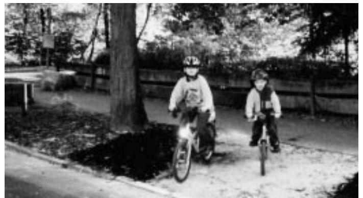
Am Ritterweiher: Vorher (oben) und nachher – eher suboptimal ausgeführt.