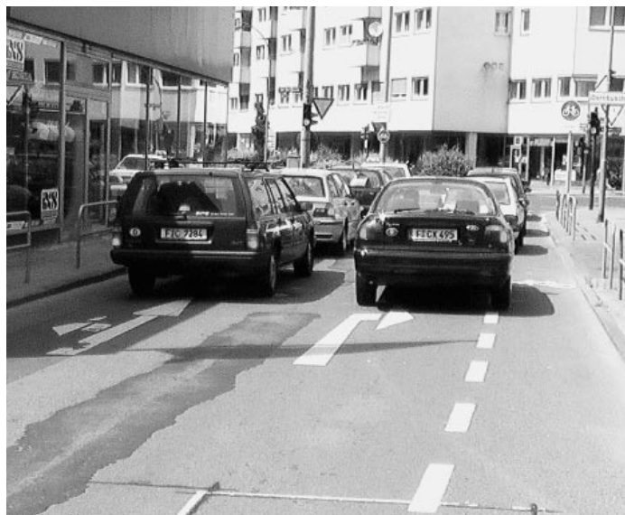
Platzhirsche unter sich – Schutzstreifen am Dornbusch