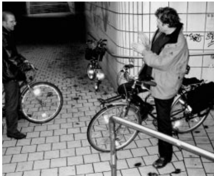
Problematische Gestänge – Edelstahlgeländer in der Unterföhrung Woogstraße

Wie verhindert man, dass Fuß- gänger und Radfahrer sich gegen- seitig in die Quere kommen? Man stellt Ihnen Hindernisse in den Weg! So haben sich das zumindest die Planer der Unterföhrung >>