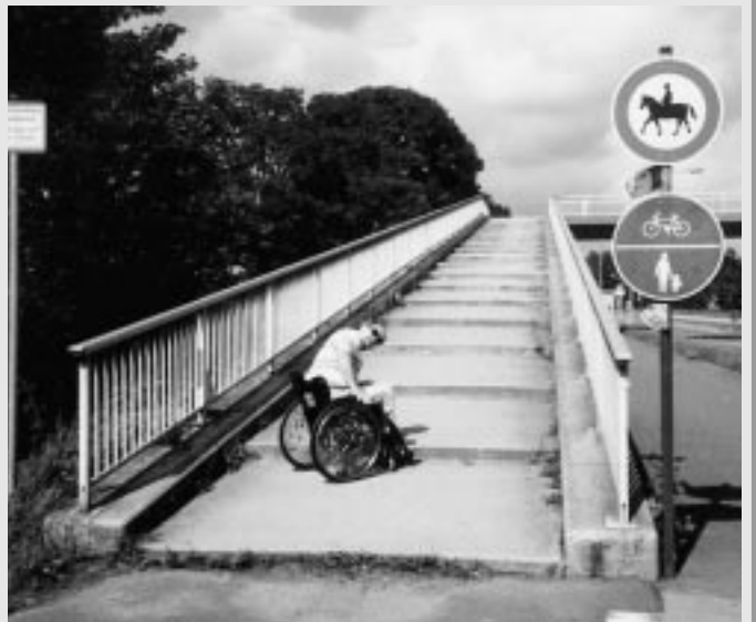
Überführung am Heiligenstock über die B3