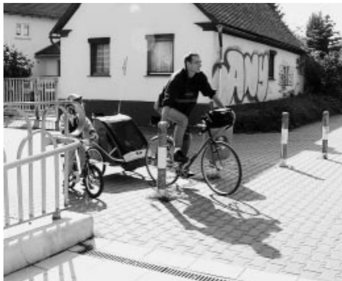
Kinderanhänger nicht vorgesehen – Hindernisparcour an der Rampe zur Unterföhrung Woogstraße